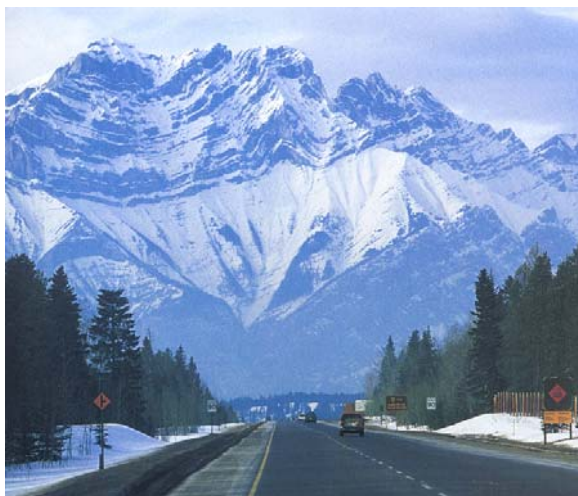
På vej til Whisler?