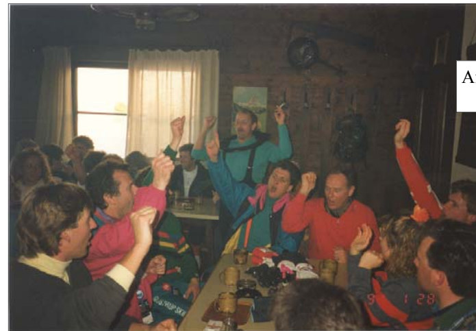
Afterski hos Fedthas...

Vi arrangerer leje af ski og støvler dernede til konkurrencedygtige priser.